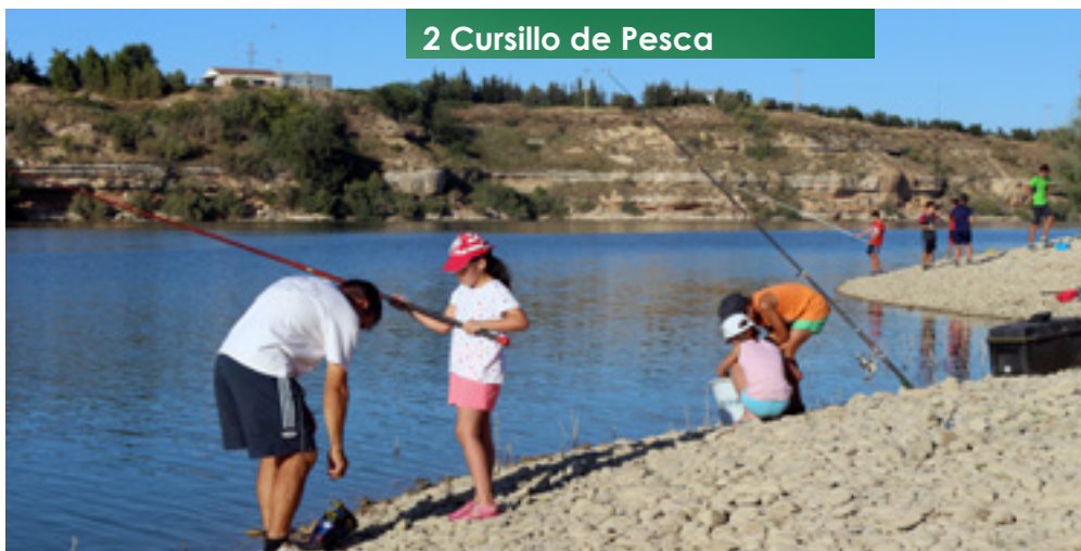
2 Cursillo de Pesca