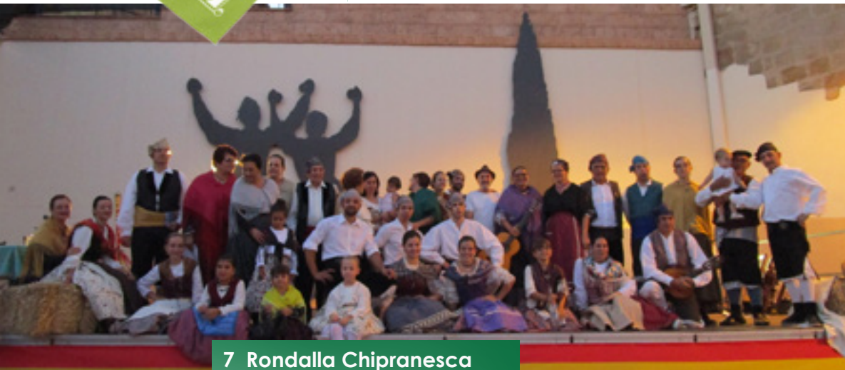
7 Rondalla Chipranesca