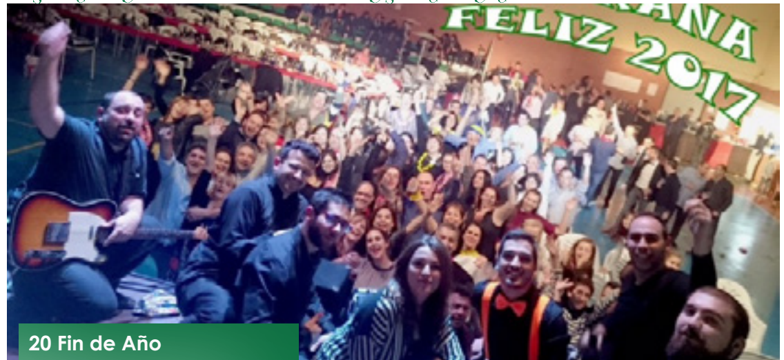
20 Fin de Año