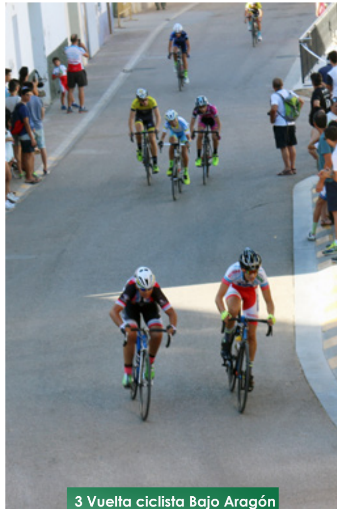
3 Vuelta ciclista Bajo Aragón