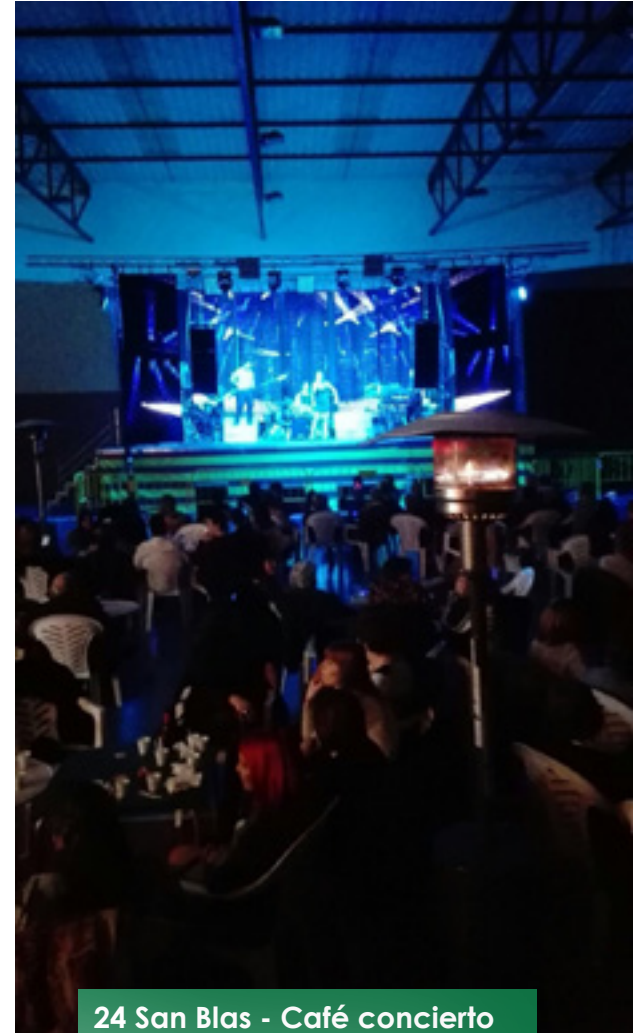
24 San Blas - Café concierto