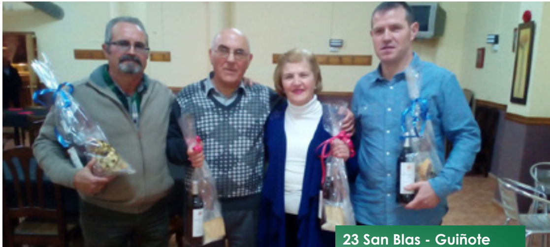
23 San Blas - Guiñote