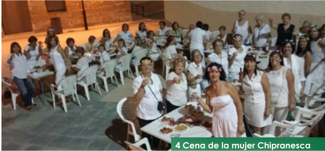
4 Cena de la mujer Chiranesca