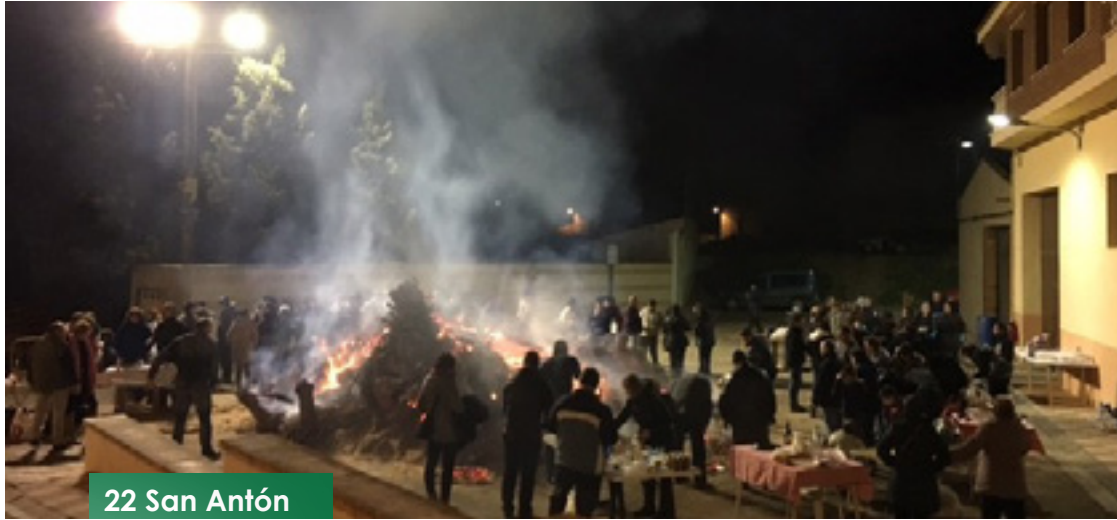
22 San Antón