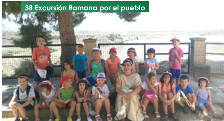
38 Excursión Romana por el pueblo