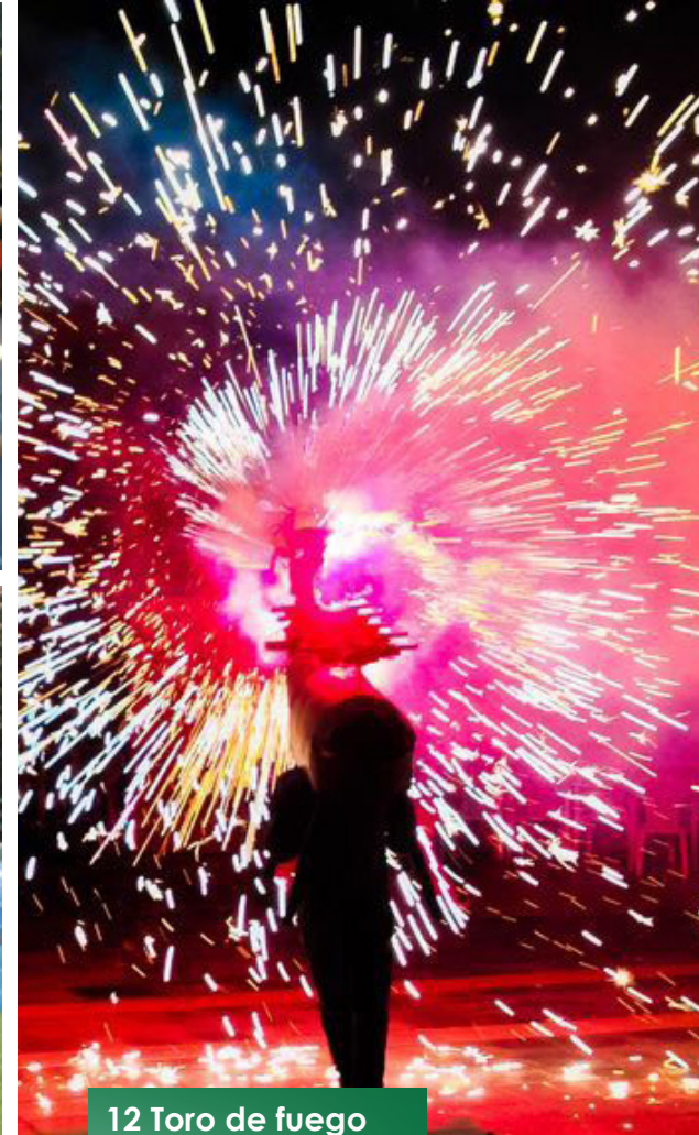
12 Toro de fuego