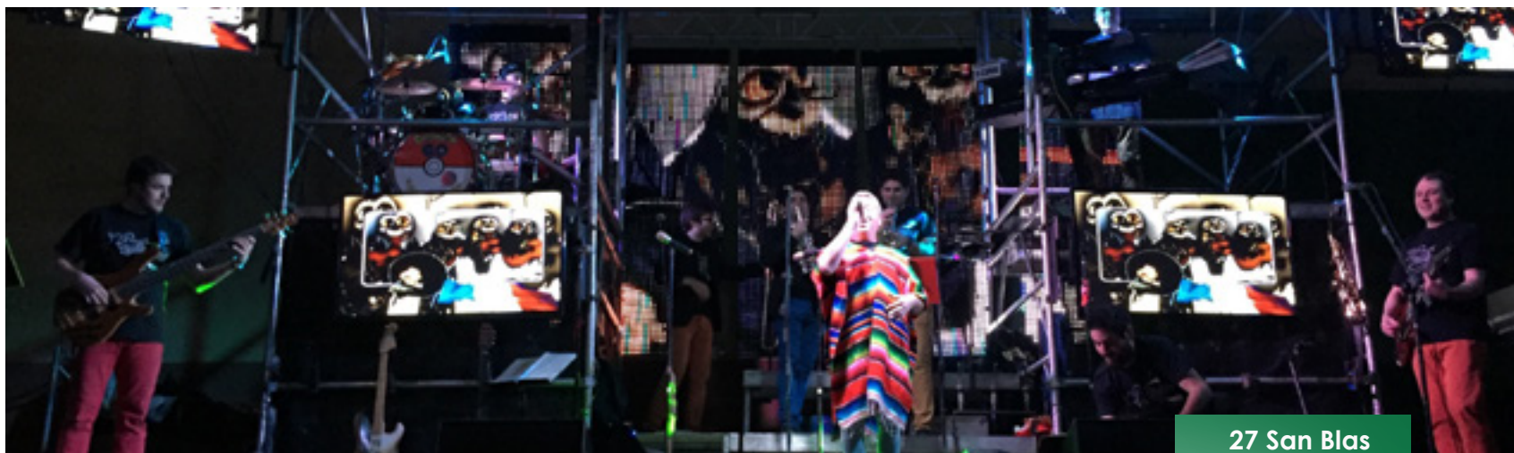
27 San Blas