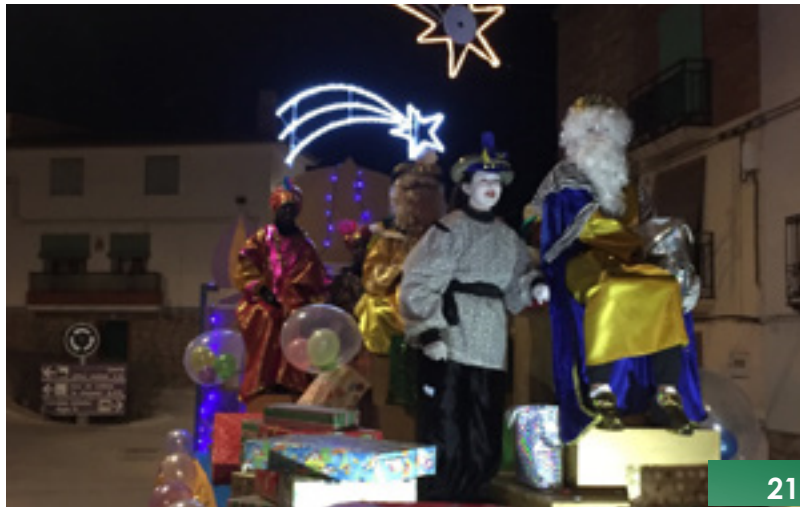
21 Reyes Magos