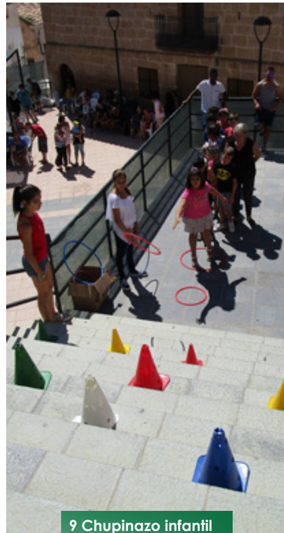
9 Chupinazo infantil