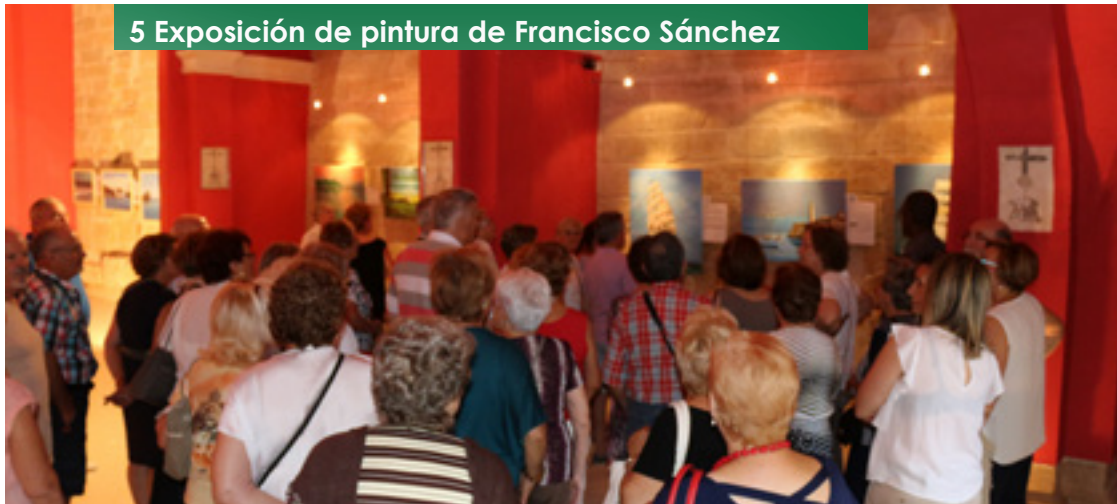
5 Exposición de pintura de Francisco Sánchez