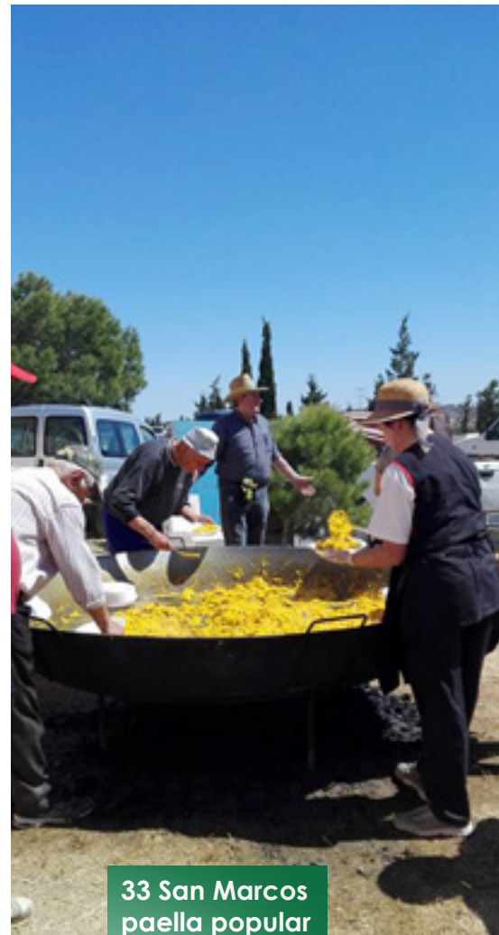
33 San Marcos paella popular