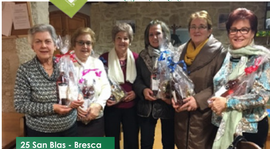
25 San Blas - Bresca