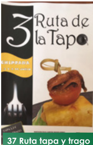
37 Ruta tapa y trago