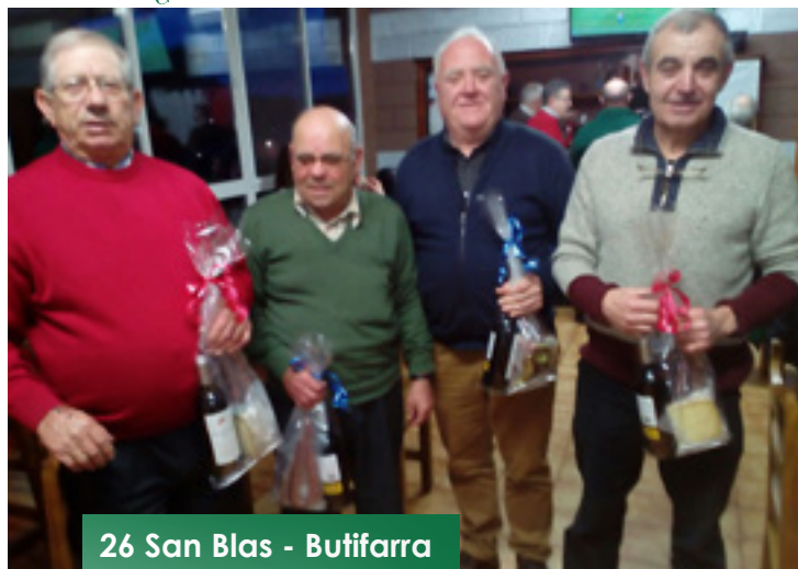
26 San Blas - Butifarra