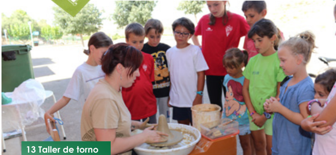
13 Taller de torno