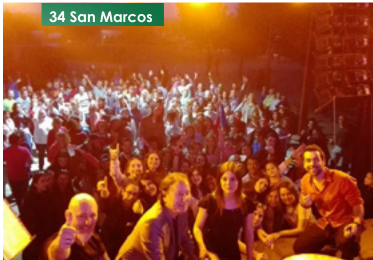
34 San Marcos