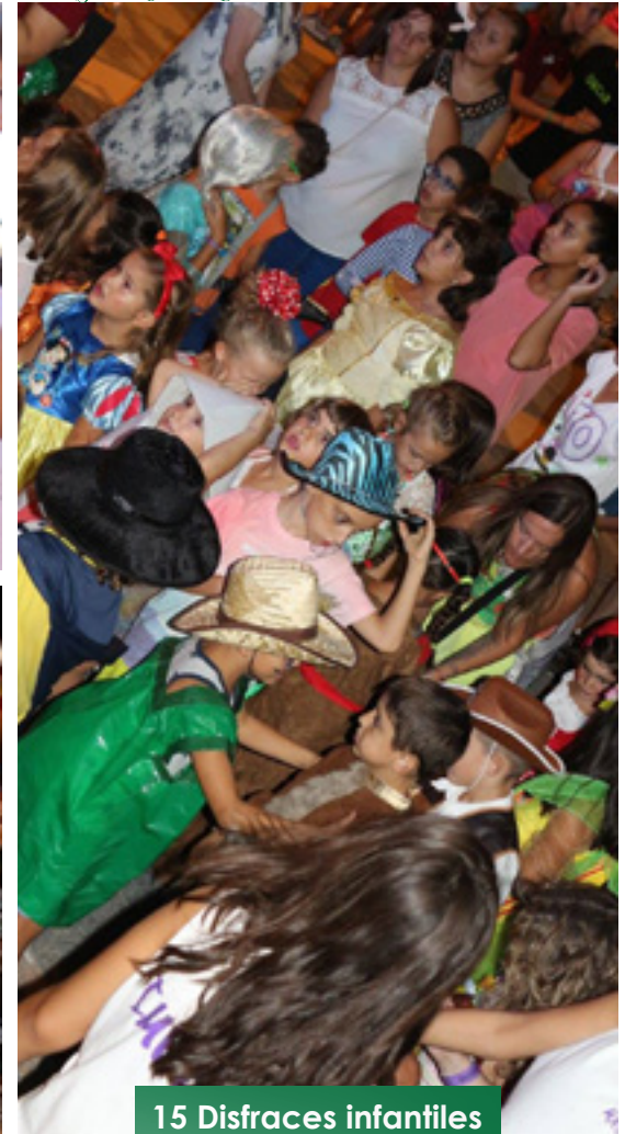
15 Disfraces infantiles