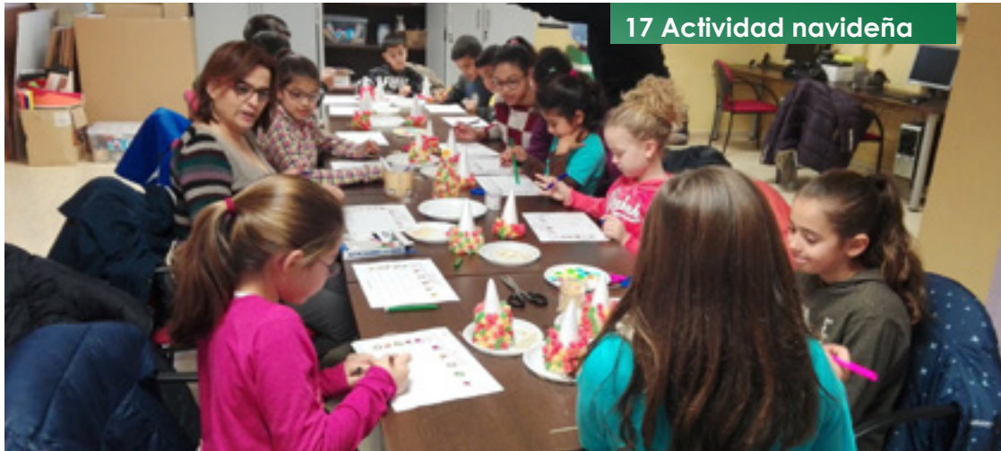
17 Actividad navideña