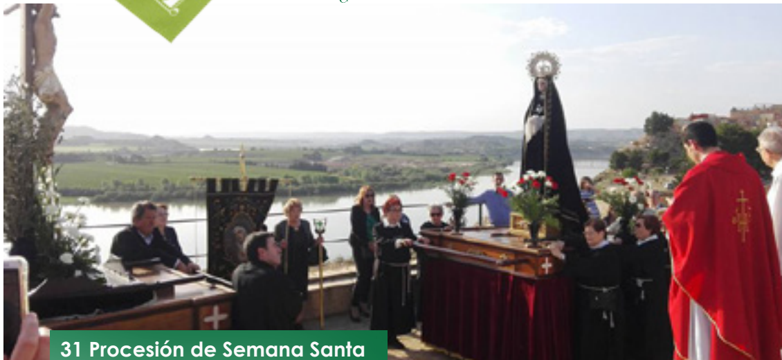
31 Procesión de Semana Santa