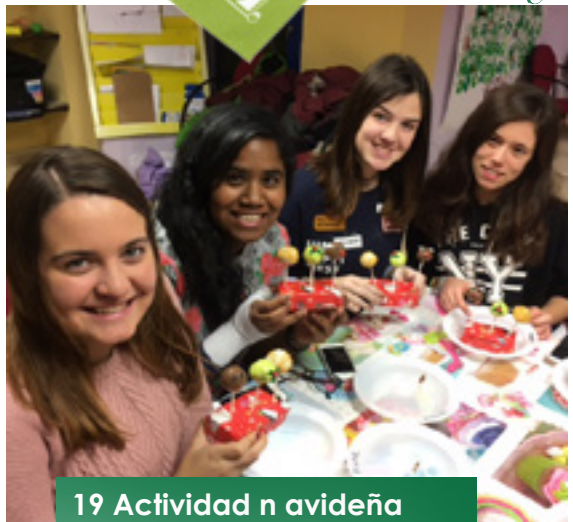
19 Actividad n avidaña