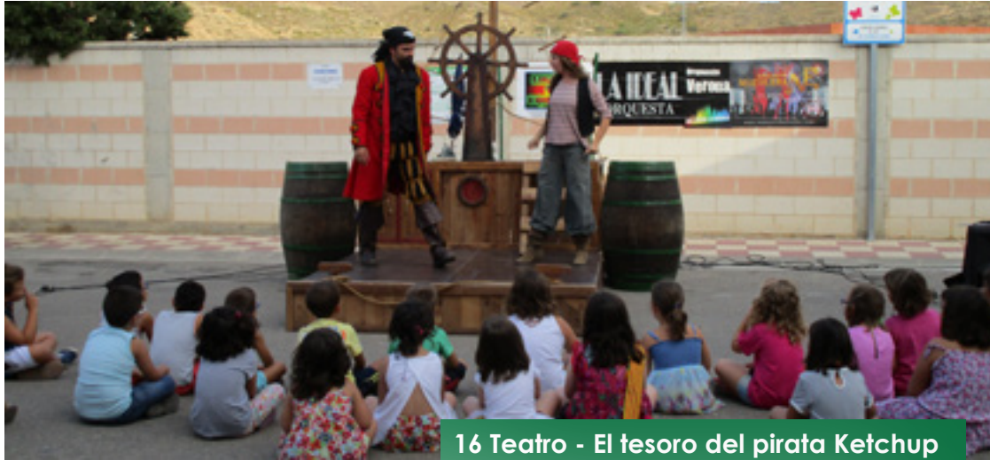
16 Teatro - El tesoro del pirata Ketchup