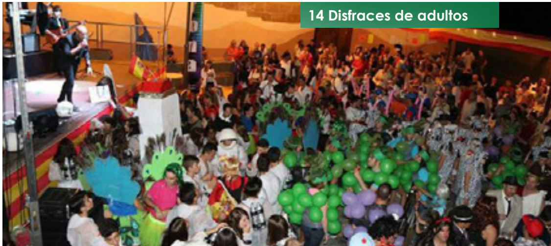
14 Disfraces de adultos