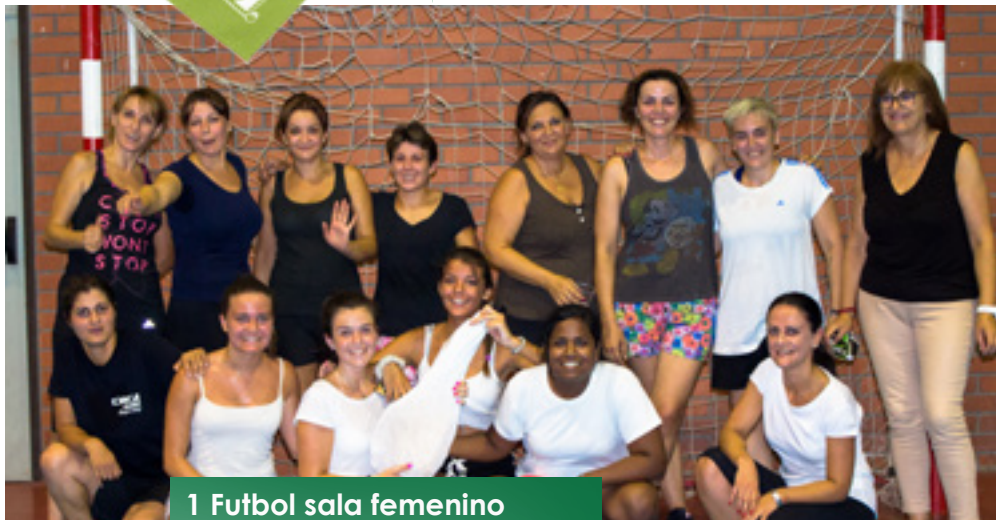
1 Fútbol sala femenino