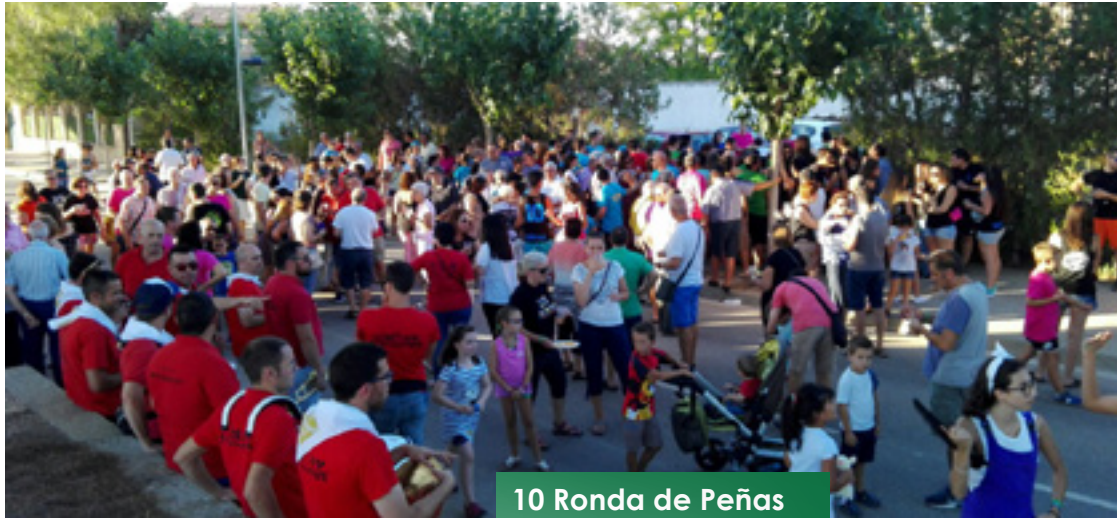
10 Ronda de Peñas