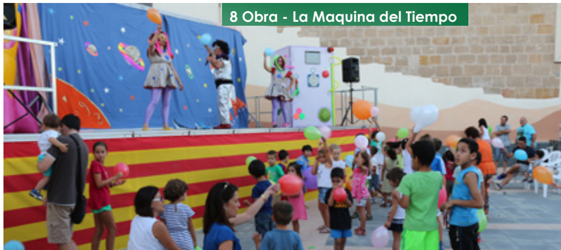
8 Obra - La Maquina del Tiempo