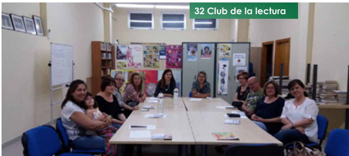
32 Club de la lectura